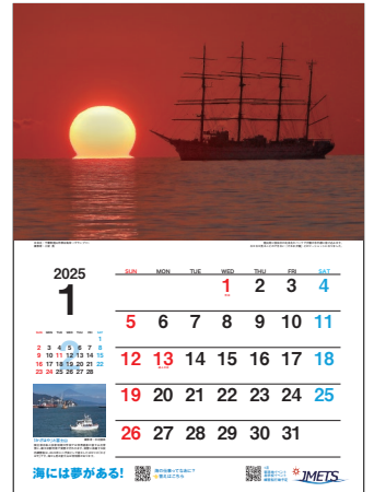
[カラーB4(見開きB3)版] 中綴じタイプ

※お支払いは商品送付時に請求書を同梱しますので、銀行振込または郵便振込をお願い申し上げます (振込手数料はご負担ください)。