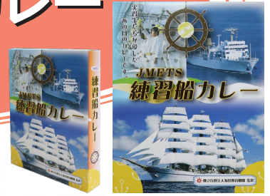
練習船で提供されるカレーを忠実に再現

今年も海技教育機構監修の「2025年オリジナルカレンダー」と「練習船カレー」を120セット限定販売します！